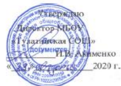
График работы школьного спортивного клуба «АТЛАНТ» на 2020-2021 учебный год.